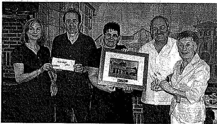
Reparto de premios del pasado año con Fotoetxe y Bareak.