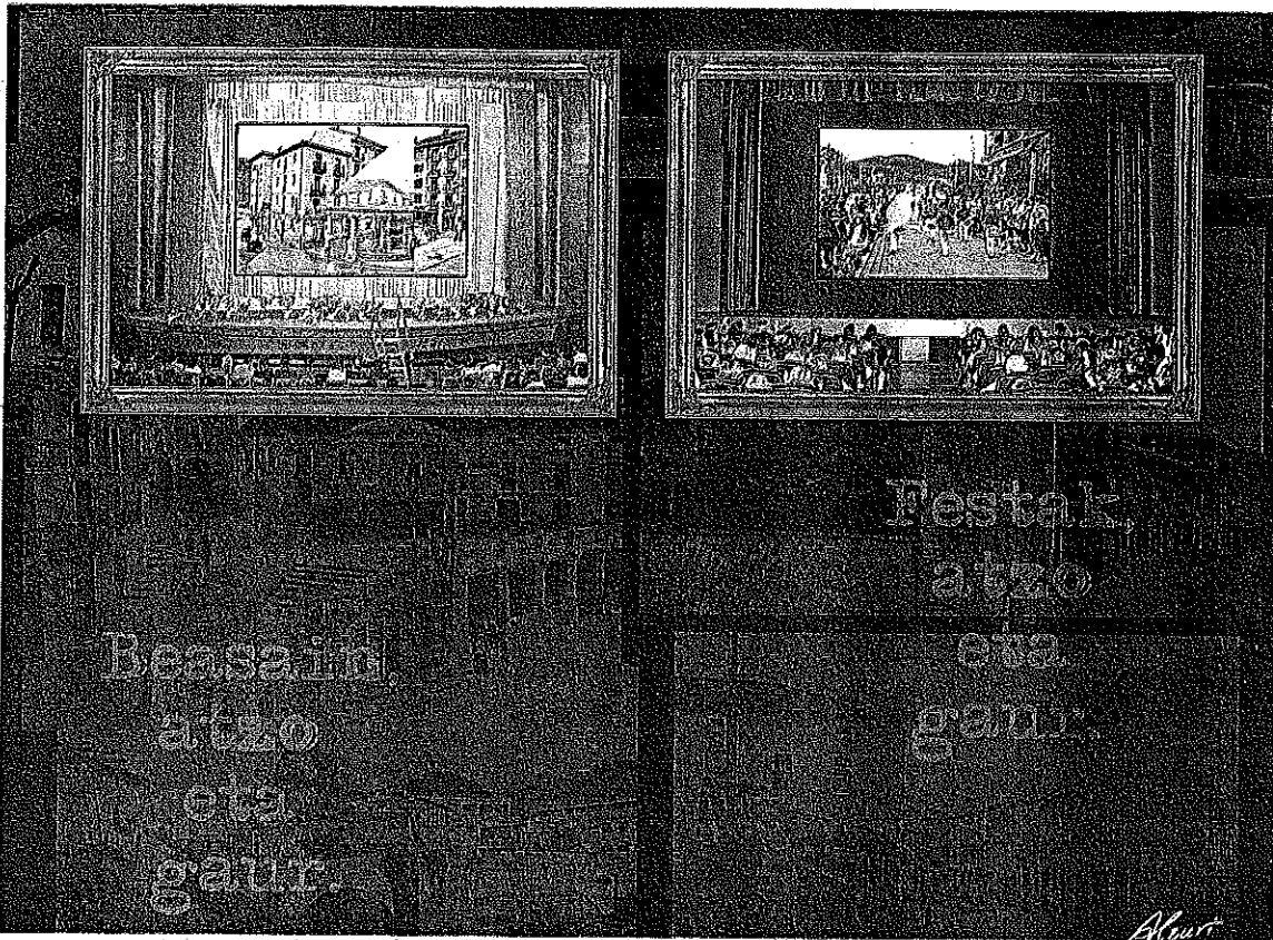
Alzuri mostró el pasado año el Beasain de ayer y el de hoy, en un montaje que se llevó el premio del jurado.

«Cuando me preguntan hasta qué punto es importante el comercio para un municipio siempre hago la misma pregunta: ¿Te imaginas cómo sería Beasain sin tiendas y sin bares? Un pueblo sin vida», asegura y por si no había quedado claro subraya que el comercio beasaindara es «de calidad, moderno, y con una oferta muy variada tanto en productos como en precios».